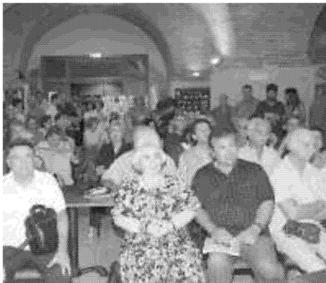
CORRADO SALVINI/PIRELLA GÖTTSCHE LOWE

Mamma Franca col figlio Robertino (in alto a destra) alla presentazione del libro e a destra una tuta militare esposta nella mostra